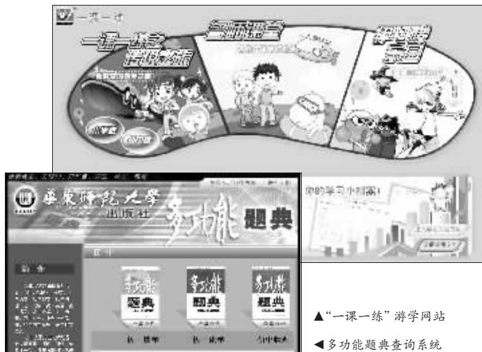
▲“一课一练”游学网站 ▲多功能题典查询系统